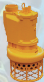
для откачки пескосодержащих и глинистых жидкостей