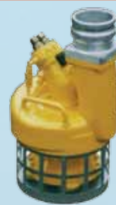
для откачки нефтешлама и вязких жидкостей